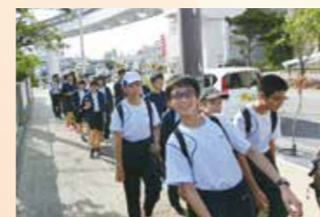
長距離ウォーキング