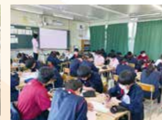
ピンクシャツデー