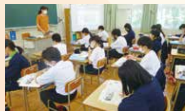
基礎学力トレーニング