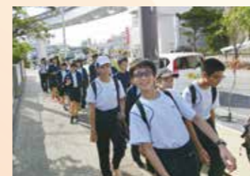
長距離ウォーキング