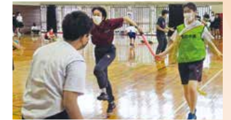
チャレンジマッチ