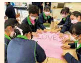
ピンクシャツデー