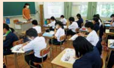
基礎学力トレーニング